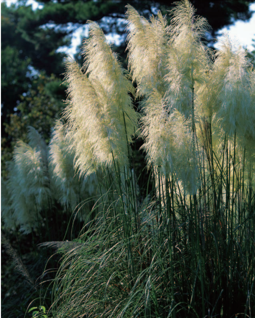
銀葦 (しろがねよし)