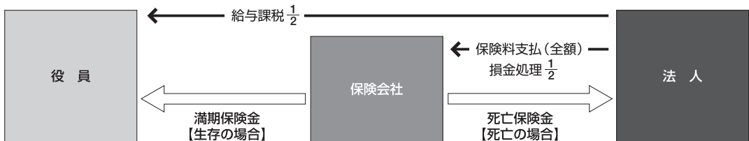
図表2 ■ 全額損金算入プラン